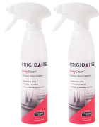
10FFSSCL02 Nettoyant pour acier inoxydable ReadyClean™ – Paquet de 2